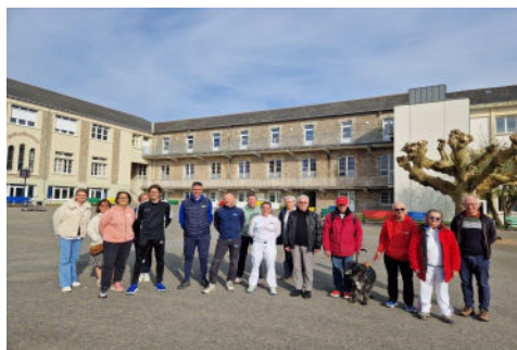
Groupe des bénévoles de la « Journée de la différence »

La classe de 6ème D a participé à différentes activités dont :