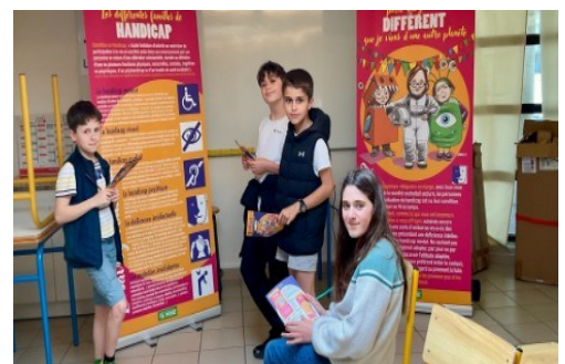
Collégiens devant l'exposition sur les différences