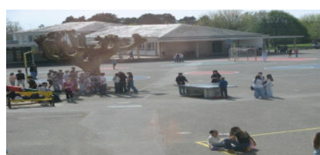
Nolan DUPUIS 5A

Globalement, les élèves jugent la cour comme un espace ni nul, ni parfait mais juste comme il faut pour bien y vivre les temps de pauses.