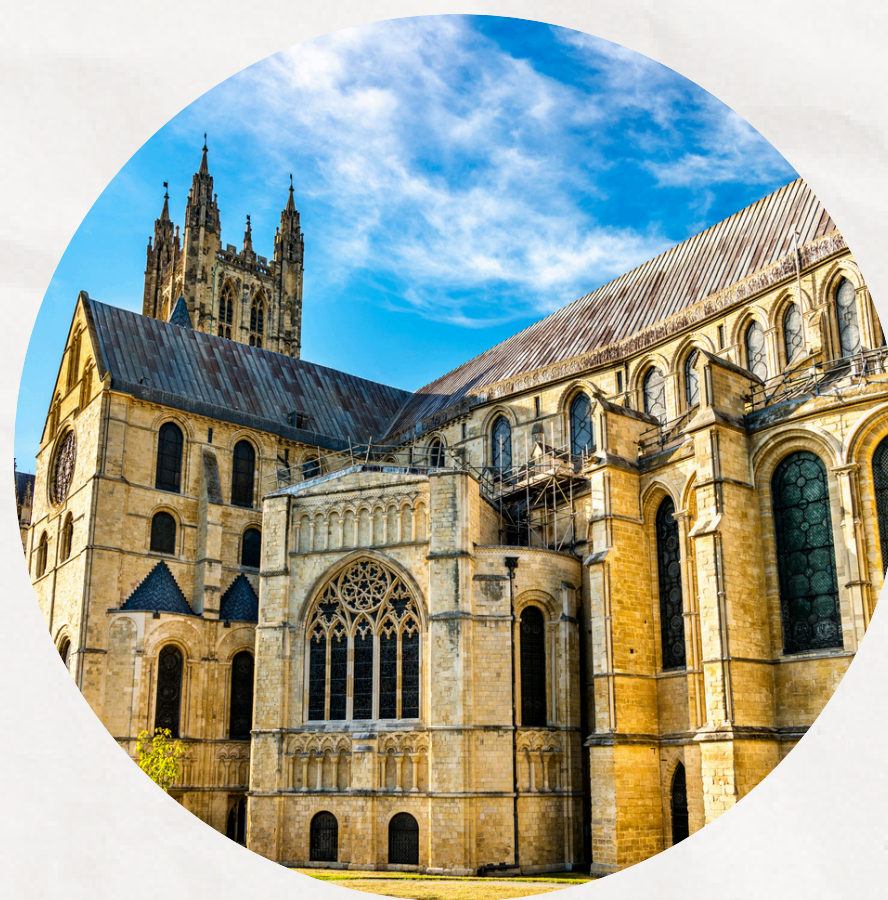
CATHÉDRALE DE CANTERBURY