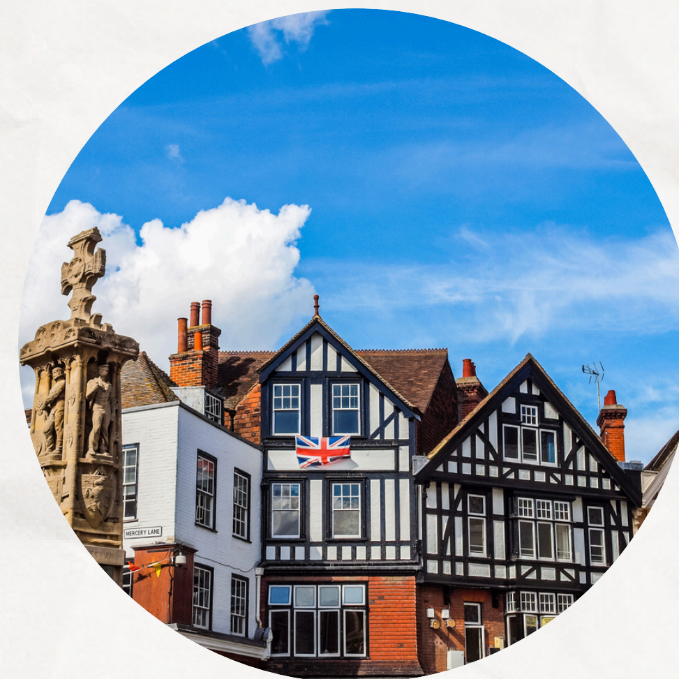
VILLE MÉDIÉVALE DE CANTERBURY