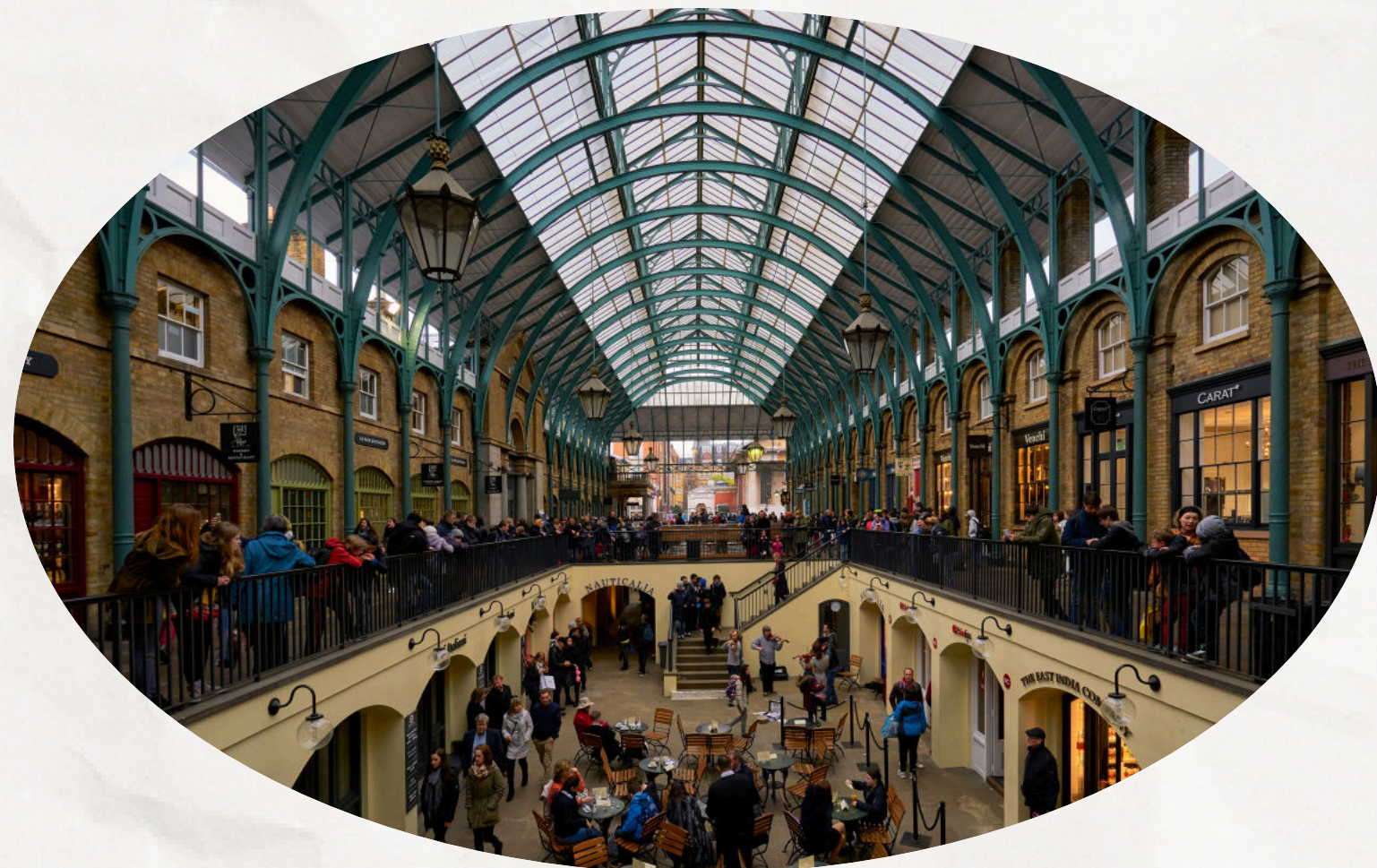
TEMPS LIBRE À COVENT GARDEN

VERS 20H00, ROUTE VERS DOUVRES. PRÉSENTATION AU PORT DE DOUVRES VERS 22H00 POUR LES FORMALITÉS D'EMBARQUEMENT.