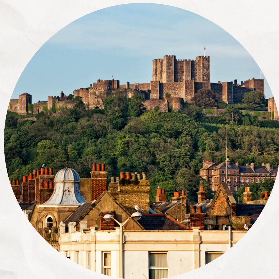
CHATEAU DE DOUVRES