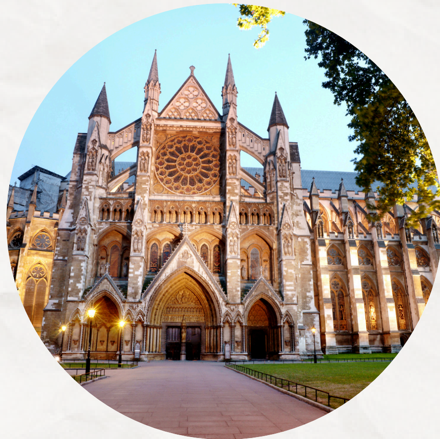
CATHÉDRALE DE WESTMINSTER