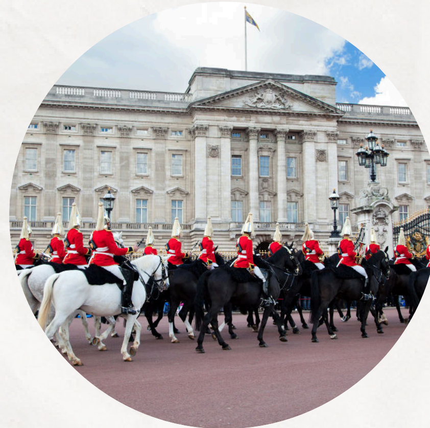
BUCKINGHAM PALACE - RELÈVE DE LA GARDE