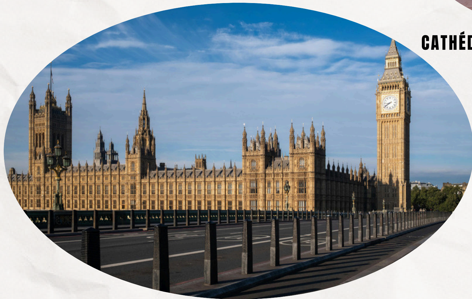
HOUSES OF PARLIAMENT - BIG BEN