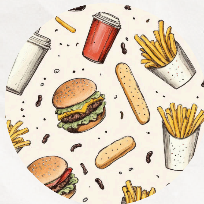
DINER DANS UN FAST FOOD