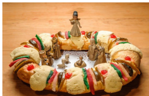
Esta una rosca de Reyes.